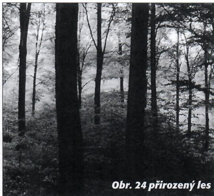
Obr. 24 přirozený les