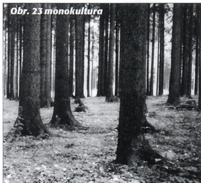
Obr. 23 monokultura

Oba typy lesů mají své výhody a nevýhody. První má výhody spíše pro člověka, druhý spíše pro přírodu. Prohlédněte si dobře obrázky a zkuste k nim přiřadit výroky napsané pod nimi.